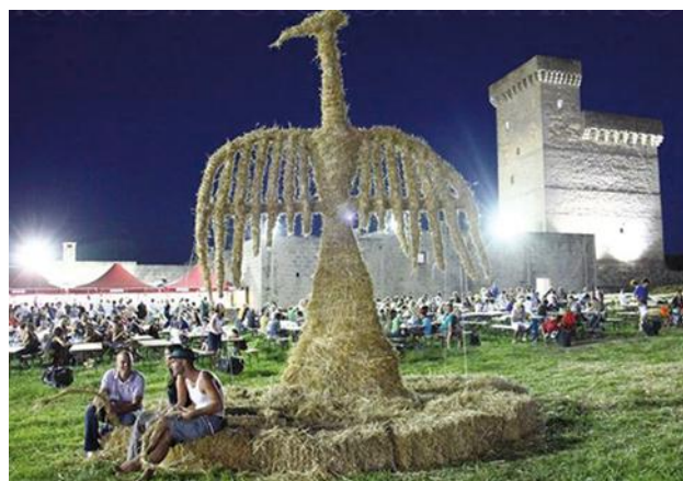
Festa del grano ad Acquarica (LE) – edizione del 2015

L'evento ha attirato negli ultimi anni migliaia di visitatori e si è messo in evidenza come uno dei più apprezzati e di successo, sia tra la popolazione autoctona sia tra gli ospiti in vacanza nel Salento durante il periodo estivo. Ogni anno durante la sagra vengono installate alcune opere e raffigurazioni dell'arte fatte di paglia, impressionante esempio ne è la Taranta che si abbarbica su una torre di vedetta situata in prossimità del luogo ove la Sagra si svolge. Tra le opere in paglia vi è anche la figura de La Fenice, un'altra icona appartenente alla tradizione e alle credenze popolari salentine, questa infatti viene simbolicamente incendiata al termine della manifestazione