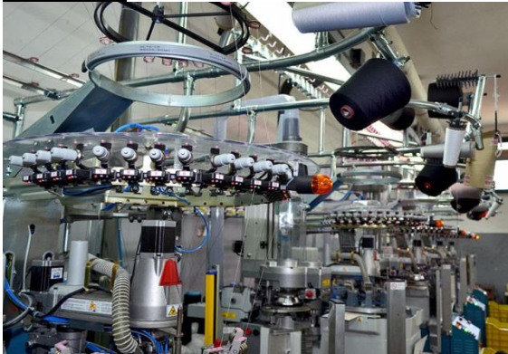
Interno di un calzificio salentino