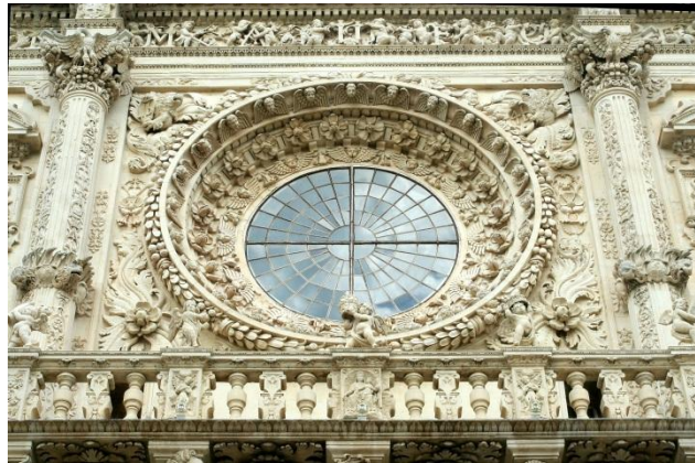
Esempio di Barocco leccese – Dettaglio del Rosone della Basilica di Santa Croce in Lecce

Riguardo all'occupazione, in provincia di Lecce si registra nel medio termine una riduzione del numero di occupati e un aumento dei disoccupati, in analogia con quanto osservato sull'intero territorio nazionale. Tuttavia, nell'ultimo biennio, si registra una sostanziale stabilità determinata da una variazione positiva del numero dei lavoratori nell'industria, in particolare in quella manifatturiera, che ha compensato positivamente le flessioni registrate nei settori dei servizi e dell'agricoltura.