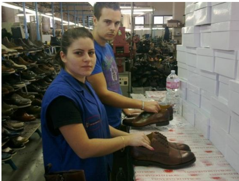
Giovani operai calzaturieri al lavoro