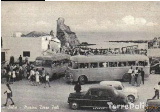
Spiaggianti di una marina salentina anni 70