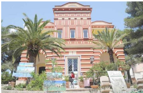
Ville in festa – S.Maria di Leuca