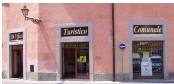
Sportello turistico culturale di una Pro Loco