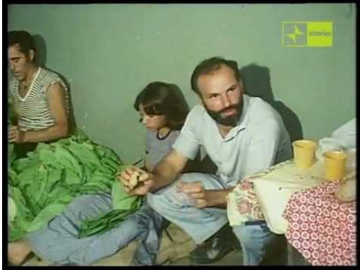
Lavorazione del tabacco in famiglia