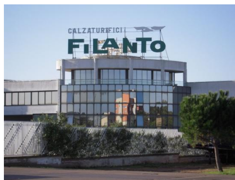
importante calzaturificio salentino

Negli anni settanta i giovani terminate le scuole dell'obbligo hanno iniziato ad abbandonare i campi e di lavorare quindi in famiglia ed hanno fatto ingresso in fabbrica, nei grossi calzaturifici. Migliaia di ragazzi poco più che quindicenni hanno subito affollato le fabbriche e la dentro hanno costruito le loro famiglie e con i loro guadagni le loro case, insomma l'economia girava forte in quegli anni. Purtroppo quando gli imprenditori salentino hanno iniziato ad intravedere più convenienti investimenti nei paesi dell'est anche questa grossa risorsa economica ha iniziato il suo rapido declino. Molti salentini hanno dovuto reinventarsi un nuovo lavoro, pochi invece coloro che hanno avuto la fortuna di continuare a lavorare per le poche fabbriche ancora dedite al tipo di lavorazione.