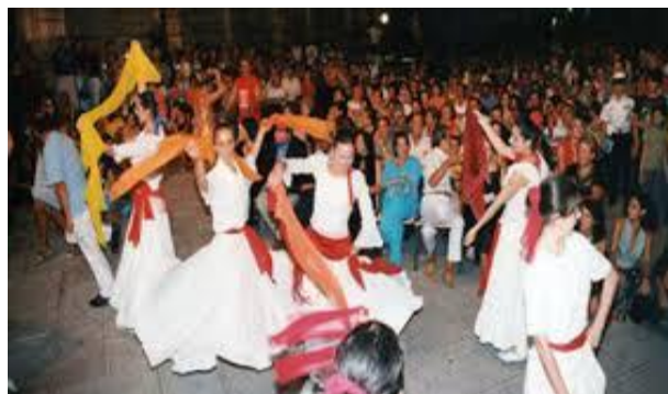
La notte della Taranta – edizione 2016 – la vera “pizzica” leccese