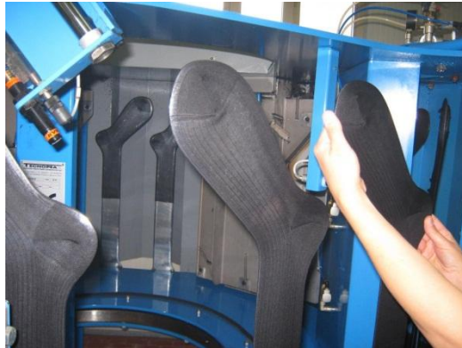
Stiratura delle calze

Anche questa attività molto trainante in contemporanea a quella del calzaturiero, la differenza sostanziale tra le due attività era dimensionale, mentre il calzaturificio era organizzato in forma industriale quella dei calzifici era pressoché a condizione familiare, quasi un po' come accadeva per il tabacco. Anche questa attività molto fiorente negli anni 80 e 90 ha avuto un veloce declino alla fine del ventennio menzionato. La prima rilevante manifattura per calze fu istituita a Parigi durante il regno di Luigi XIV, grazie all'attività del meccanico Hindret. Ma solamente nel 1869 fu costruita la prima macchina a mano in grado di fabbricare tutte le parti della calza contemporaneamente tre anni dopo Grinswold migliorò a tal punto gli automatismi della macchina, da trasformarla in un modello di riferimento valido per gran parte del Novecento.