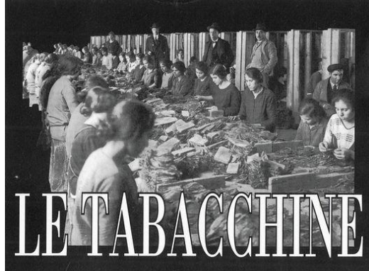
Tabacchine al lavoro nei grandi magazzini

Le famiglie, tutte riunite, si dedicavano dapprima alla piantagione (marzo), alla successiva raccolta ed infilaggio del tabacco, il quale veniva essiccato durante tutta l'estate e poi venduto durante l'inverno a più ricchi imprenditori o ad organizzate cooperative. Dopodiché le donne continuavano a lavorare, duramente a "GIORNATA" il tabacco presso dei locali magazzini di raccolta. L'anno successivo si ricominciava, molte famiglie, quelle che non possedevano terreni propri, si spostavano nei territori del tarantino o addirittura in Basilicata per la coltivazione del tabacco. Questo tipo di attività ci ha accompagnato sino ai primissimi anni novanta. Numerosi e visitabili sono i luoghi adibiti a magazzini e laboratori sparsi sul nostro territorio, allo stesso tempo facile è anche prendere visione di quelli che erano gli attrezzi di allora utilizzati per le diverse lavorazioni.